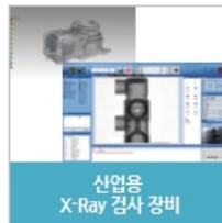
산업용 X-Ray 검사 장비

끊임없는 연구개발을 통하여 주조, 다이캐스팅, 자동차 부품의 비파괴 검사를 위한 대형 고효율 X-Ray 검사장비에서 전자, 식품, 제약, 보안 분야에 이르기까지 다양한 X-ray 검사장비를 개발하여 공급함으로써 산업용 X-Ray 검사장비 분야의 리더로 성장해 나아가겠습니다.