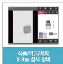
식품/이물/제약 X-Ray 검사 장비